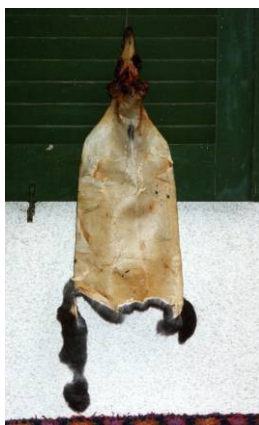
Rongée par des animaux

La peau tendue est séchée hors de portée des chiens et des chats dans un endroit ombragé, à l'air libre, ou dans un local bien aéré (protégé contre les mouches). La peau doit être sèche en une semaine. Des conditions inappropriées sont l'exposition au soleil, une chaufferie, une cave humide et des conditions humides.