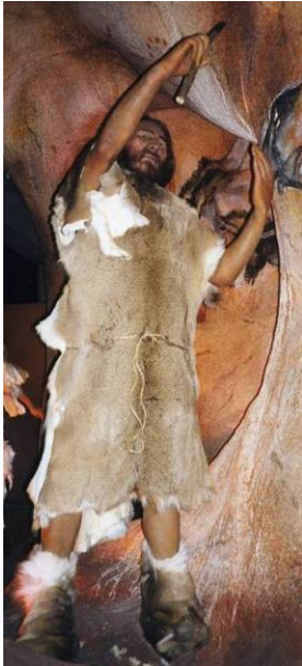
Mode de la fourrure hier ...